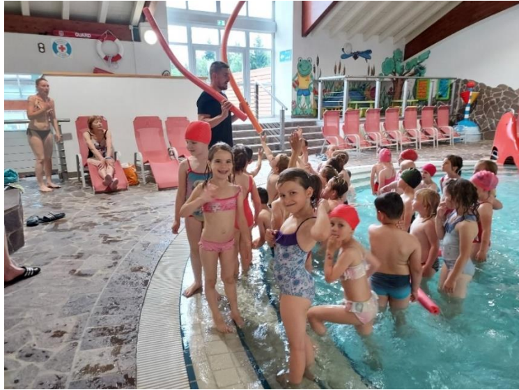
16. 5. – 27. 5. PLAGALNI TEČAJ